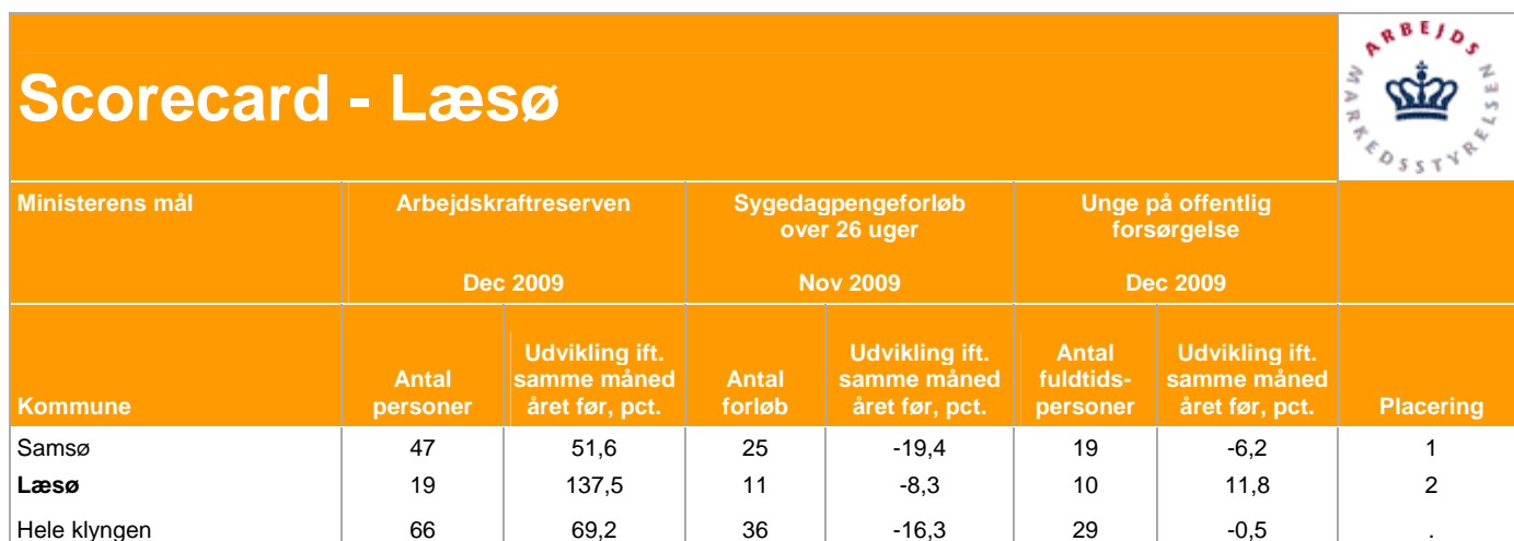
Dataoversigt 2: Scorecard – Minister mål. December 2009

Antallet af personer og forløb for den viste periode vil generelt være undervurderet som følge af efterregistreringer. Det vil især være tilfældet for sygedagpenge- og a-dagpengemålingerne, hvor antallet af fuldtidspersoner ved den efterfølgende opdatering typisk vil stige med omkring 5-6 procent, og antal forløb med omkring 7-10 procent